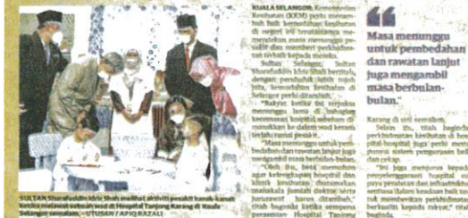
SULTAN Sharafuddin Idris Shah melihat aktiviti pesakit berakut di Hospital Tanjung Karang di Kuala Selangor semalam.