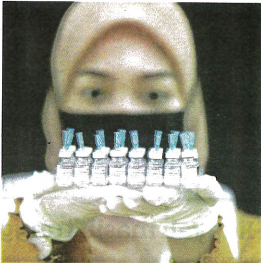
BUTIRAN mengenai perolehan vaksin Covid-19 didakwa dibuat tanpa persetujuan Jabatan Peguam Negara (AGC). – GAMBAR HIASAN

"Tujuan kita nak hentikan, siapa sahaja Perdana Menteri, Menteri Kewangan atau menteri selepas ini, jangan anggap itu tempat untuk dia kayakan anak menantu dia, itu pengajarrannya," katanya.